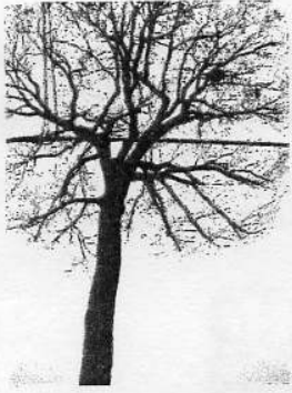
杉並区保護樹木 阿佐谷南1丁目 大谷家「大けやき」