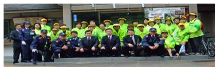
馬橋地区視察 09' 4.17

四月十七日午後、山下警視庁生活安全部長がご近所付き合い広目隊の活動を視察したいと急遽馬橋にられました。馬橋児童館までパトロールをしながら馬橋の地域を視察されました。いつも掲示している防犯のポスターや桃園川緑道の花壇を見ながらにこのこと質問されました。