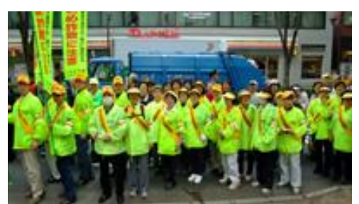
振り込め詐欺被害者撲滅キャンペーン