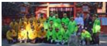
11/30 四丁目夜回り隊視察